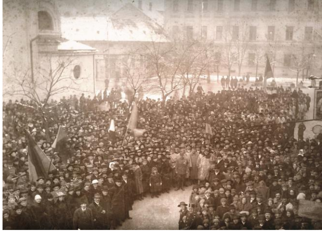
Lugoj, 1919: întâmpinarea Diviziei XI Orientale a Armatei Franceze (Muzeul de Istorie, Etnografie și Artă Plastică Lugoj)